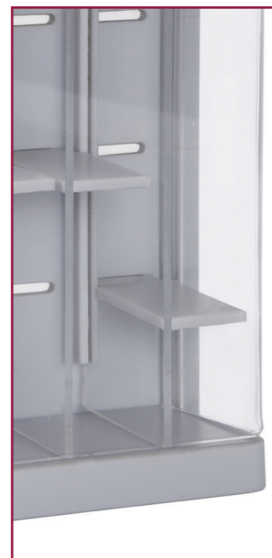
_Variable Einteilung für unterschiedlich Katheter - einfache und flexible Aufbewahrung

Katheter unterschiedlicher Größen und Längen können in der Scan Modul - Katheterbox dank der verstellbaren Einstellböden und der variablen Inneneinteilung problemlos gelagert werden. Die Scan Modul - Katheterbox kann vielseitig befestigt werden - beispielsweise direkt an Pflegewagen oder Wandschienen. Die Montage erfolgt werkzeuglos und ist innerhalb weniger Sekunden erledigt.