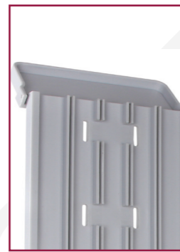
_Klappdeckel für eine sichere und hygienische Aufbewahrung

Die Scan Modul - Katheterbox erfüllt die DIN 58593 und ermöglicht die praktische Aufbewahrung von Kathetern. Die Abdeckhaube der Box sorgt für maximale Hygiene, die Reinigung der Box ist jederzeit einfach durchzuführen. Eine sichere und hygienische Aufbewahrung wird durch diese Eigenschaften gewährleistet.